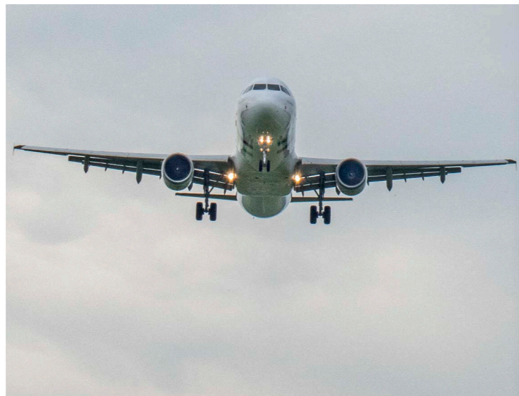
Aufnahme eines landenden Flugzeugs im Anflug auf die Piste 14 zur Bildkombination

Selbst Teleobjektive mit eher kürzerer Brennweite können eingesetzt werden, denn solche haben in der Regel den Pluspunkt, lichtstärker zu sein.