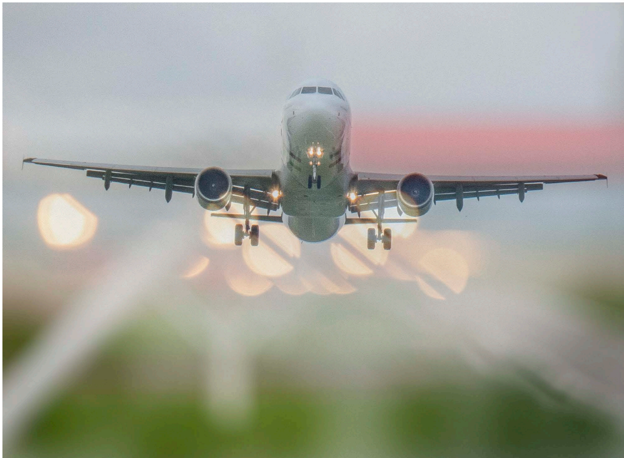
Bildkombination «Piste 14 im Flughafen Zürich» aus den zwei Aufnahmen «Flugzeug», als Teilfoto von Joana Burki, und «Beleuchtung»

Bildbearbeitung Die Aufnahmen von Joana und mir habe ich anschliessend in der Bildbearbeitung miteinander kombiniert. Ebenen, Masken und Transparenzen halfen dabei, unterschiedliche Bildteile zu verstärken und abzuschwächen, sie partiell zu über- und zu unterlagern.