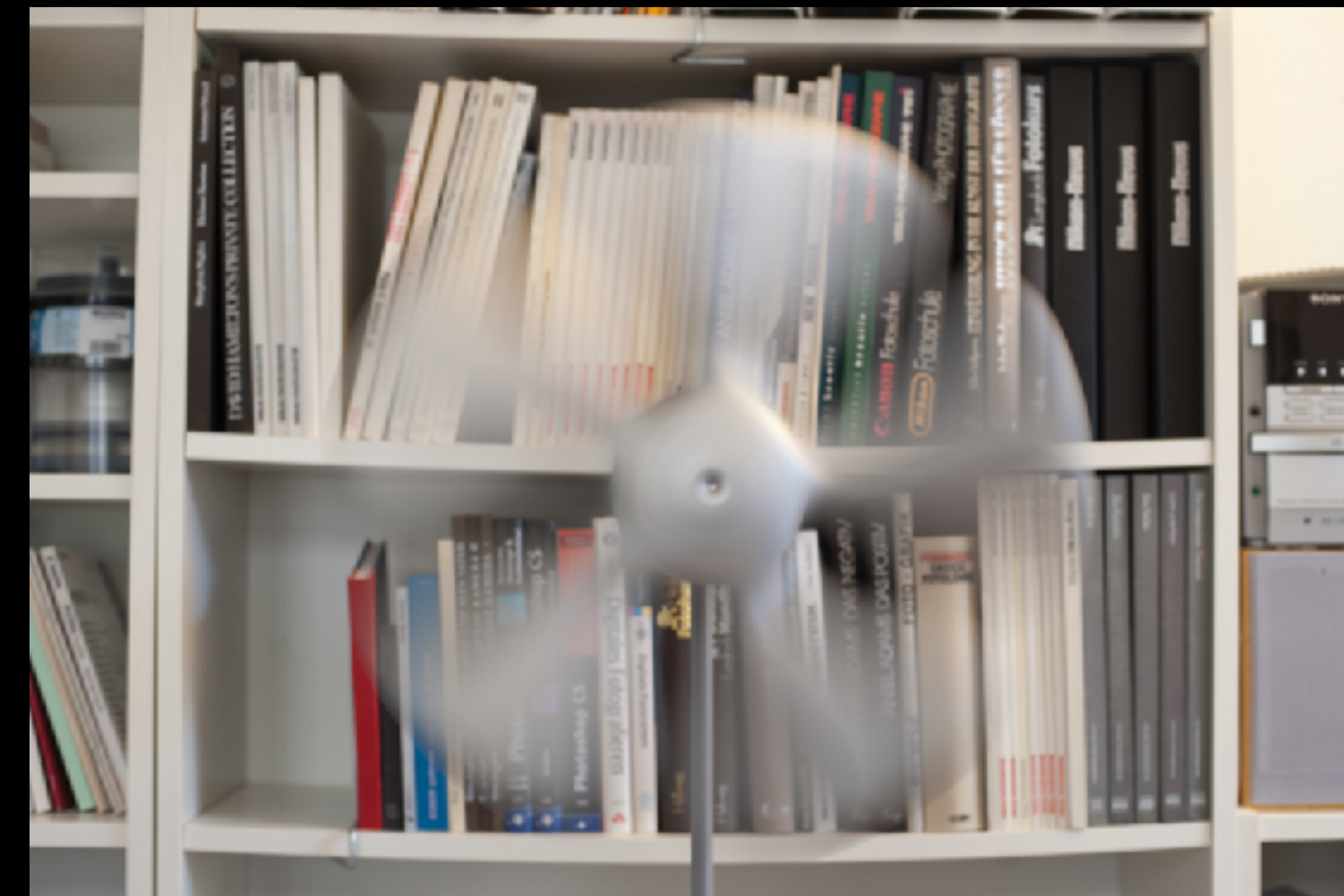
symbolisiert mit langer Belichtungszeit

Die Drehgeschwindigkeit des Ventilators war in beiden Aufnahmen gleich langsam.