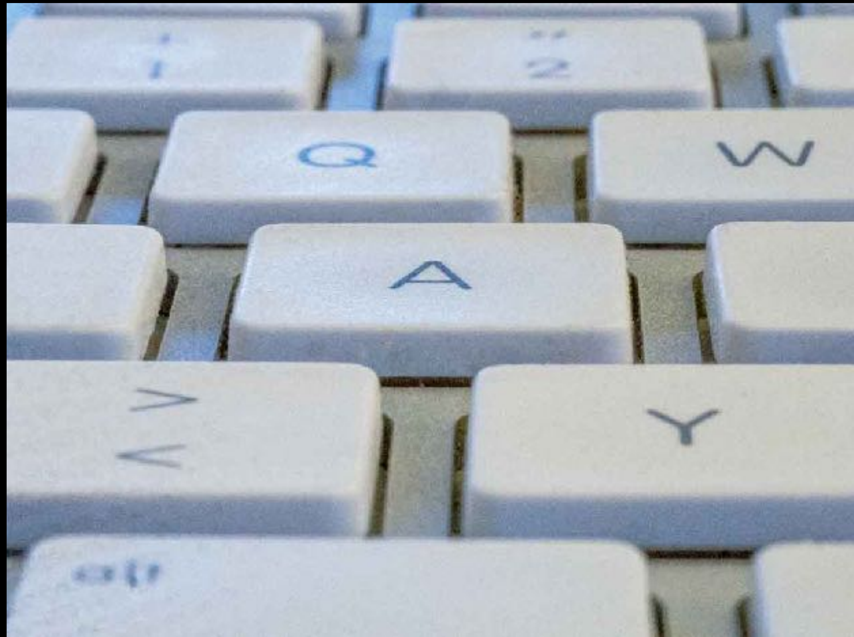
volle Schärfe mit kleiner Blendenöffnung

Den Schärfeumfang bestimmen wir mit einer Wahl der Blendenöffnung.