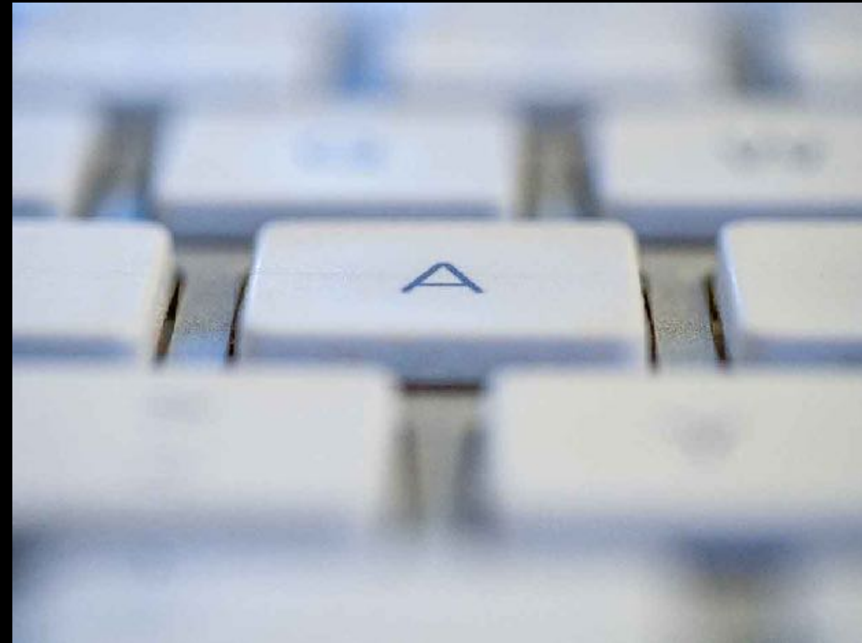
gezielte Schärfe mit grosser Blendenöffnung

Entfernung in beiden Aufnahmen unverändert auf Taste «A».